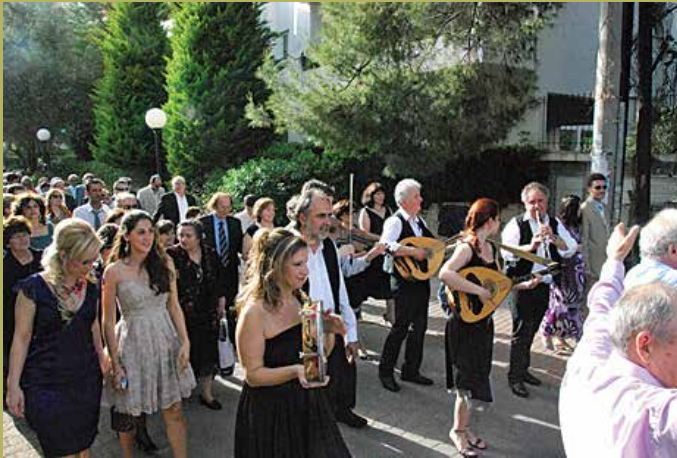
Παραδοσιακή Ηπειρώτικη κομπανία «Λαλητάδες»

Στο τέλος της εκδήλωσης θα γλεντήσουμε αντάμα όπως αρμόζει σε Ηπειρώτες και Αρκάδες