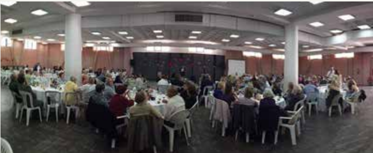
Το Πάσχα της Αγάπης Εκδήλωση για φιλανθρωπικούς σκοπούς