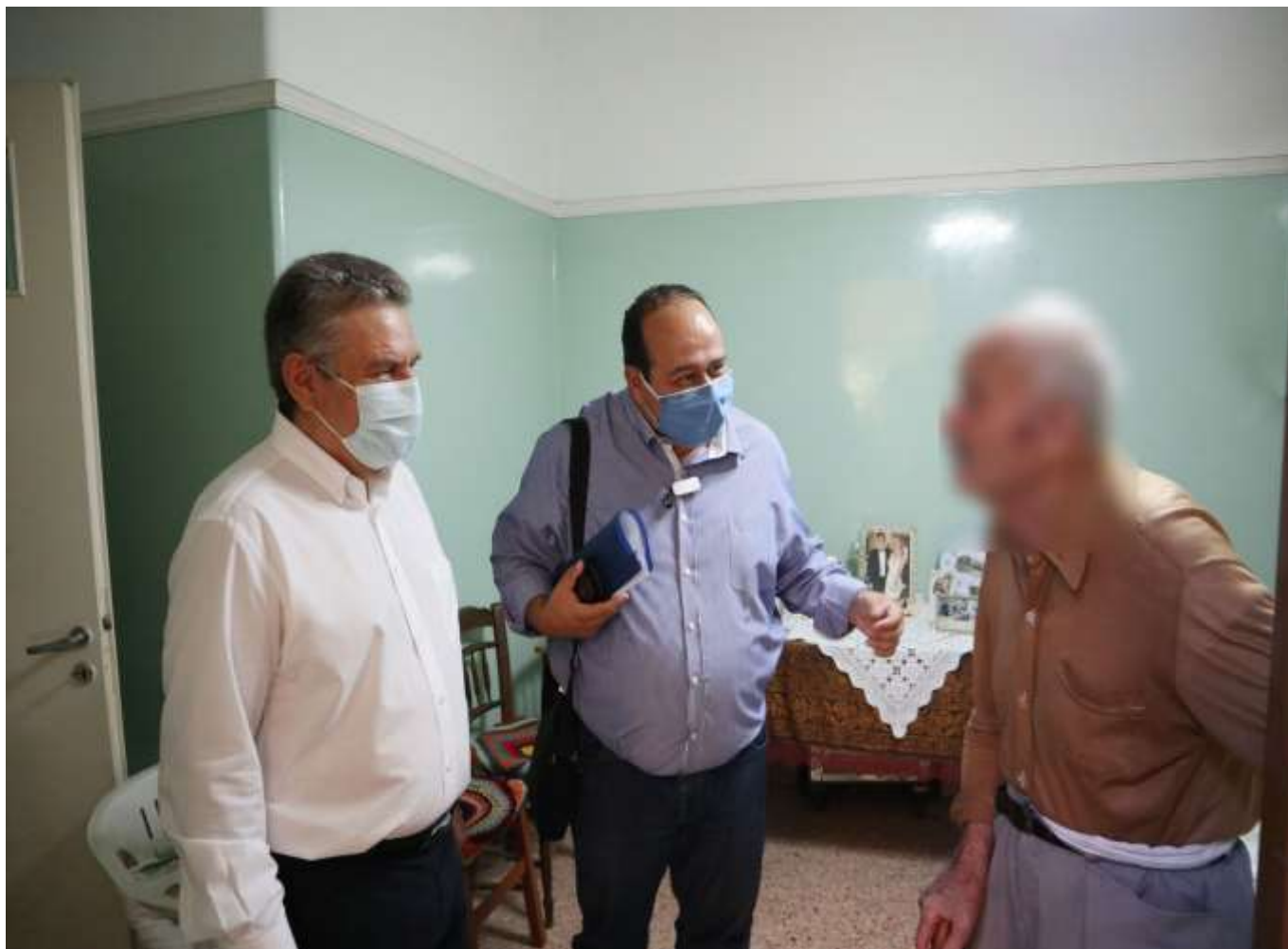
Ο Δήμαρχος Ιλίου Νίκος Ζενέτος και ο Αντιδήμαρχος Κοινωνικών Υπηρεσιών Δημήτρης Βασιλόπουλος, κατά την εφαρμογή της νέας υπηρεσίας τηλεφροντίδας σε ωφελούμενους