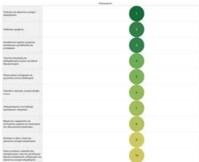
Εικόνα 2: Ιεράρχηση των Δυναμικών Επαγγελματιών και Κλάδων - Μισθωτή Εργασία Ιδιωτικού Δικαίου στο Δ. Ιλίου, 2018