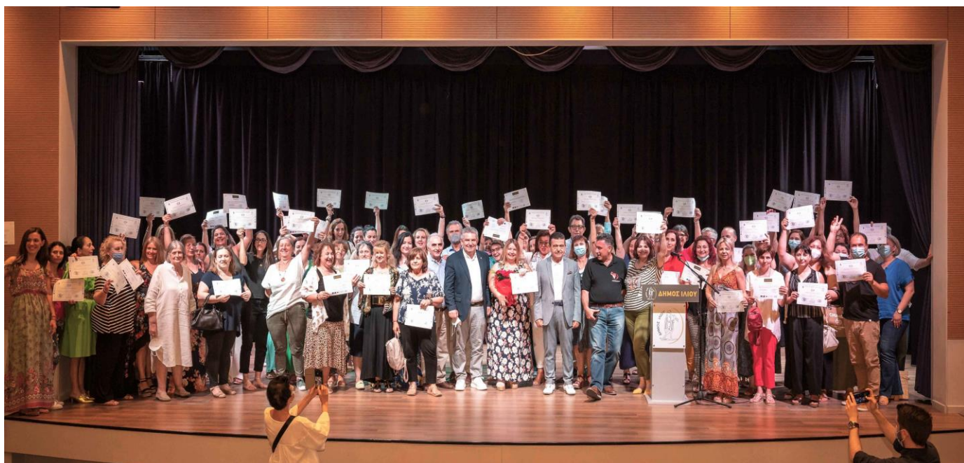
Αναμνηστική φωτογραφία με τους αποφοιτήσαντες