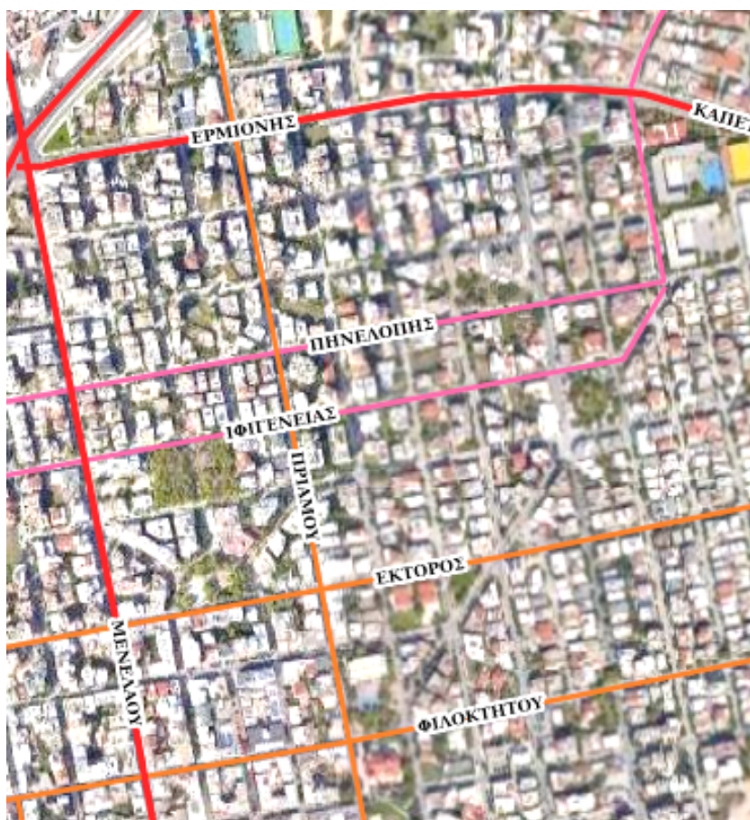
Εικόνα 1.1: Ιεράρχηση οδικού δικτύου στη περιοχή καθορισμού προτεραιοτήτων

Συγκεκριμένα, οι οδοί Ερμιόνης και Μενελάου κατατάσσονται στο βασικό οδικό δίκτυο, οι οδοί Έκτορος και Πριάμου, χαρακτηρίζονται βασικές συλλεκτήριες , ενώ οι υπόλοιπες ανήκουν στο τοπικά οδικό δίκτυο με χαρακτήρα πρόσβασης και παραμονής( βλ. εικόνα 1.1).