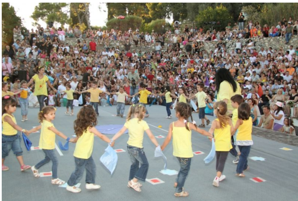
Στιγμιότυπα από το 6 ο Παιδικό Φεστιβάλ Ιλίου