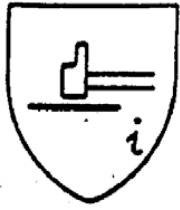
Σχήμα 1 : Εικονόσημο προστασίας από μηχανικούς κινδύνους για τα γάντια από ύφασμα και νιτρίλιο (είδος No 2).