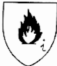
Σχήμα 3 : Εικονόσημο προστασίας από μηχανικούς κινδύνους και θερμότητα για τα γάντια συγκολλητών (είδος No 3).